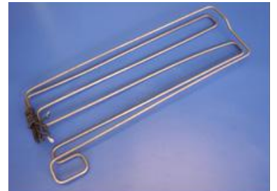
גוף חימום להפשרת קרח המצטבר במקפיא

חלק מהיצרנים מפעילים את מערכת ההפשרה למשך זמן קצוב וקבוע, כפי שהוגדר מראש על-ידי היצרן, ויש מן היצרנים שמתקינים רגש המפסיק את ההפשרה לפי נתוני המקפיא.