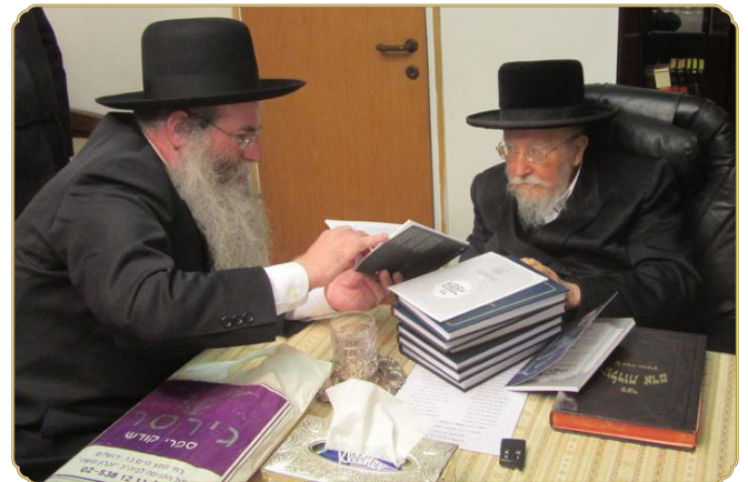
ראש המכון הגרא"מ הלפרין בשיח תורני עם כ"ק מוה"ר האדמו"ר מביאלה שליט"א

הני-מילי? ולמה לו לרבי יהושע-בן-לוי להוכיח כן מן הכתוב? והלא מן הסתם ידע כן רבי חנינא-בן-דוסא מניסיונו רב השנים, כמי שהיו באים אליו הרבה לבקשו להעתיר ולבקש רחמים על החולים, שבכל פעם שהיתה תפילתו שגורה בפיו התקבלה התפילה, וכשלא היתה שגורה בפיו נדחתה? ויישב זאת, כי על סמך הניסיון גרידא, גם אם מדובר בניסיון עשיר שהוכיח את עצמו פעם אחר פעם ללא דופי, לא היה רבי חנינא-בן-דוסא מהין בנפשו להחליט ולקבוע בבירור לומר "זה חי וזה מת", ורק מחמת שמן הכתוב מוכח כן יכול היה לומר כן בהחלטיות ובבטחון מלא.