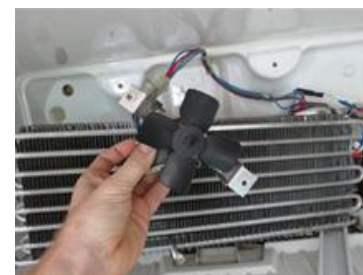
מאוורר פיזור אוויר בתוך מקפיא

יודגש, כי מדובר בפעולה ישירה של פתיחת הדלת או סגירתה, באמצעות שחרור המפסק או לחיצתו, ולא בגרמא או בפעולה עקיפה.