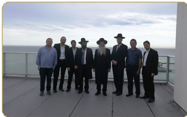
ראש המכון והרב רובינשטיין יחד עם הצוות המקומי שגובש לטיפול במעליות לאחר בדיקת חדר מעליות על גג מגדל מגורים בן 50 קומות

ביוזמת רבני המקום נבחנה כאמור, במהלך הביקור הקצר, האפשרות להתקנת מעליות שבת מהודרות, ונבדקו סוגי המעליות השונות במקום, על מנת לוודא אם אכן ניתן לבצע בהן את כל שורת השינויים הרבים המתבקשים ע"י המכון המדעי טכנולוגי להלכה בכדי לאשר אותה לכתחילה. באותה הזדמנות גם התחילו יחד לגבש ולהכשיר צוות מקומי של מהנדסים ואנשי אלקטרוניקה ומעליות, אנשים מקצועיים לצד אנשים נאמנים ויראי שמים, שימשיכו לפעול במקום בקביעות, בכפיפות לרבני המקום, תוך תיאום מלא ורצוף עם רבני מהנדסי המכון, לשם התקנת מעליות השבת המהודרות, בהתאם למפרט המושלם של המכון, על כל דרישותיו המחמירות, ולצורך פיקוח על המעליות וביקורת שנתית קבועה כדרישת המכון.