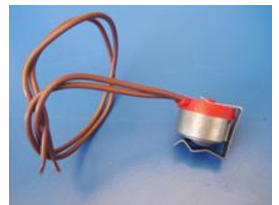
טרמוסטט ניתוק גוף חימום של מקפיא

א. ההשפעה על הקדמת ההפשרה היא בדרך כלל בסופו של תהליך ארוך וממושך לאחר סידרה ארוכה של מחזורי פעילות (ועי' בתשובת הגרשז"א הנ"ל (אות ג) שכתב לגבי השפעה דומה