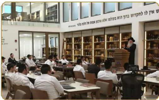
בשיעור הלכתי בהיכלי הכוללים