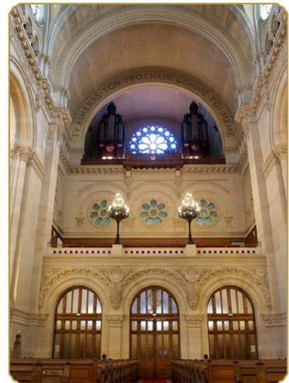
בית-הכנסת הגדול בפריז