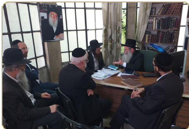
עם רבני ומהנדסי המכון

ביקור ממושך ורב רושם בין כותלי המכון ערך לאחרונה הגאון הנודע רבי עמרם פריד שליט"א, מחשובי הרבנים ופוסקי ההלכה בבני-ברק, אשר שמו הולך לפניו כמשיב דבר ד' זו הלכה בכל מקצועות התורה למאות ואלפי שואלים דבר יום ביומו.