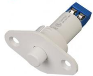
מפסק דלת פנימי - מגנטי

הדרך היעילה ביותר היא לפתוח את דלת המקפיא בעת שהמדחס פועל בכדי שהנורה תדלק, ככל וישנה, והמאוורר ייכבה, ולאחר מכן לעבור באיטיות עם מגנט חזק על כל המסגרת שסביב המקפיא, לאורכו ולרוחבו, עד שמבחינים שהנורה נכבית והמאוורר נדלק, פעולה זו מורה שהמגנט איתר את מקומו הנכון של המפסק וסגר את המעגל הגורם לפעולות המוזכרות. (במקרים נדירים עלולים להימצא כמה נקודות כאלו ויש לוודא כי כולם אותרו).