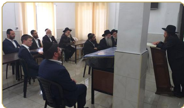
באמירת שיעור בפני אנשי המכון