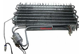
מערכת קירור עם גוף חימום להפשרה, ניתן להבחין בחיבורי החשמל מצד שמאל

הפתרון שהעלו, ונמצא ישים, הוא התקנת גוף חימום מתחת לגופי הקירור לכל אורכם, שמפשיר מפעם לפעם את שכבת האוויר החיצונית שבחלל תא ההקפאה ומונע את הצטברות הקרח.