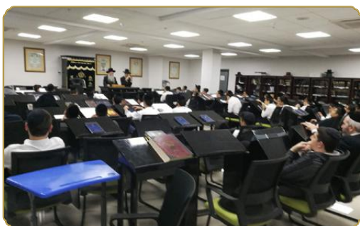
בשיעור בישיבה לצעירים בפנמה