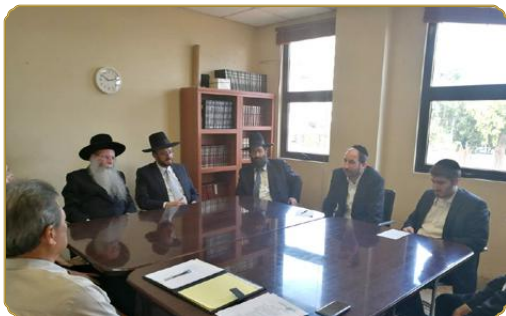
ראש המכון ורבה של פנמה בראש ישיבת הצוות המיוחד שגובש לטיפול במעליות