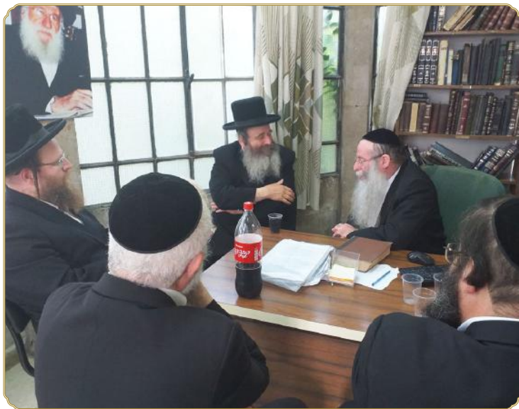
גאב"ד מלבורן עם ראש המכון ורבני המכון

בימים האחרונים זכו במכון לביקורו החשוב של גאב"ד מלבורן שבאוסטרליה, הגאון רבי שלמה קאהן שליט"א, שהגיע ארצה לביקור קצר לרגל שמחות משפחתיות.