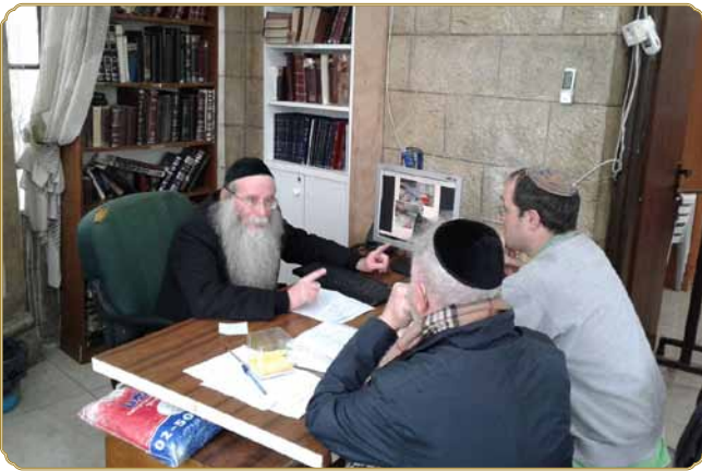
ראש המכון שליט"א בוחן יחד עם היזמים את הערכה החדשנית המיוחדת של פלטת השבת והמיכל שמתחתיה

שני יזמים שונים הגיעו בחודש האחרון למכון, לפגישה עם ראש המכון שליט"א, כדי להציע בפניו רעיונות חדשניים לפלטת השבת המסורתית, ולקבל את הסכמתו ואישורו ההלכתי.