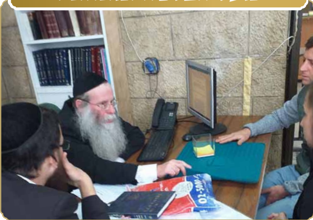
הכיסוי המיוחד לפלטת השבת מוצג ע"י היזמים בפני ראש המכון שליט"א