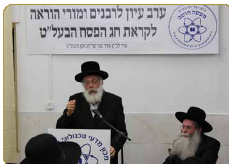
הגאון רבי משה שטיין שליט"א נושא דברים