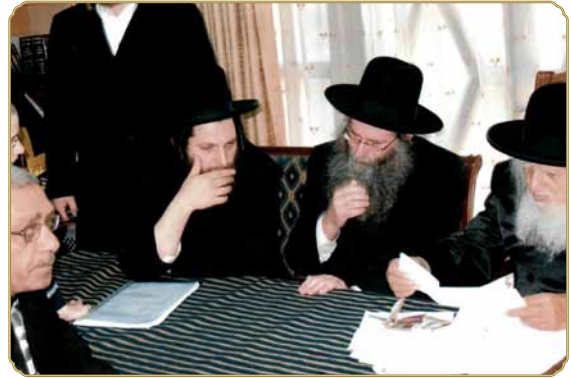
ראש המכון שליט"א, בתוקף תפקידו כראב"ד בד"ץ אונגוואר. במכירת חמץ בע"פ עם כ"ק מרן גאב"ד אונגוואר זצ"ל ויבלח"ט האדמו"ר מאונגוואר שליט"א

בהם בפרך", יכולה להתפרש בשתי פנים ובשני מובנים. בעוד שלפי פשוטו של מקרא בוודאי מדובר בעבודת כפיה מן הסוג הקשה והמפרך ביותר, הרי שמצינו על כך בדברי חז"ל (זוה"ק בראשית כז.) גילויים מופלאים, וכך נאמר שם: "כגוונא דא אמרו מארי מתניתין (כיוצא בזה אמרו בעלי המשנה), וימררו את חייהם בעבודה קשה, בקושיא, בחומר, בקל וחומר, ובלבנים, בליבון הלכתא, ובכל עבודה בשדה, דא ברייתא 1 , את כל עבודתם וגו', דא משנה 2 ".